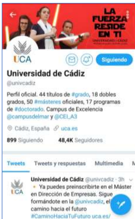
Ilustración 17. Captura móvil de la cuenta de Twitter de la Universidad de Cádiz.

Twitter es una red social centrada en el microblogging , que permite publicar tweets o mensajes de hasta 280 caracteres. Si bien fue una de las plataformas más importantes en el pasado reciente, actualmente pierde seguidores y actividad constantemente, disminuyendo en cuanto a relevancia respecto a otras plataformas, como Instagram.