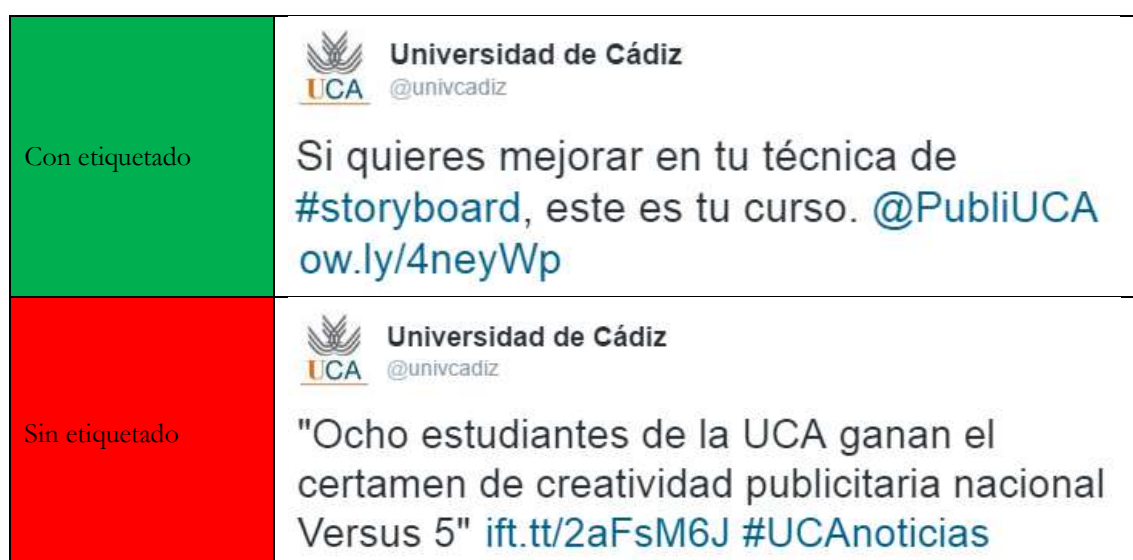
Ilustración 11. Etiquetado de stakeholders en Twitter.

Esto debe hacerse extensivo a agentes que pueden estar directamente interesados en el contenido de la publicación. Por ejemplo, una noticia sobre unos premios publicitarios podría llevar una etiqueta a @PubliUCA, perfil del Grado en Publicidad y RRPP; o, a la inversa, un tweet del Grado en Publicidad y RRPP podría llevar una etiqueta a @univcadiz, perfil institucional de la Universidad de Cádiz.