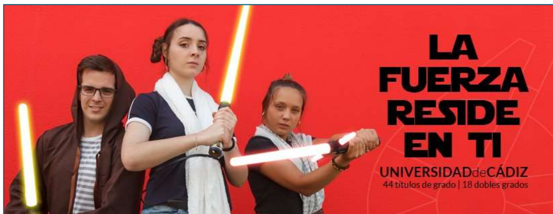
Ilustración 14. Ejemplo de imagen de portada basada en una campaña temporal.

La siguiente sería un ejemplo de portada coyuntural (es decir, para una campaña o un evento específico):