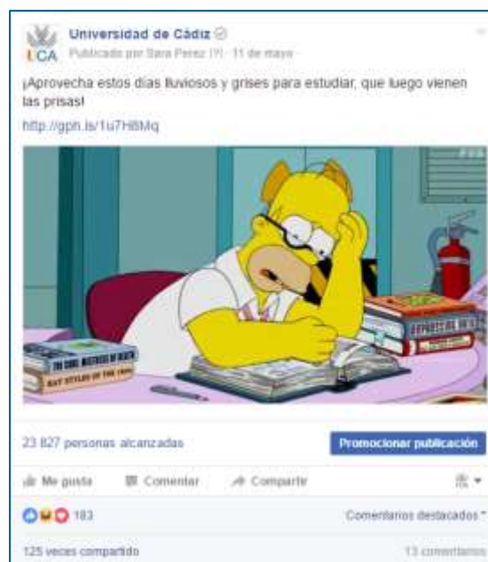
Ilustración 6. Ejemplo de publicación basada en un gif animado.