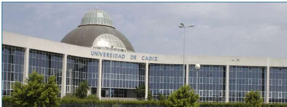
Ilustración 13. Ejemplo de imagen genérica de portada.

La siguiente fotografía sería un ejemplo de portada institucional (si bien se podrían realizar imágenes ad hoc para ser empleadas como portadas):