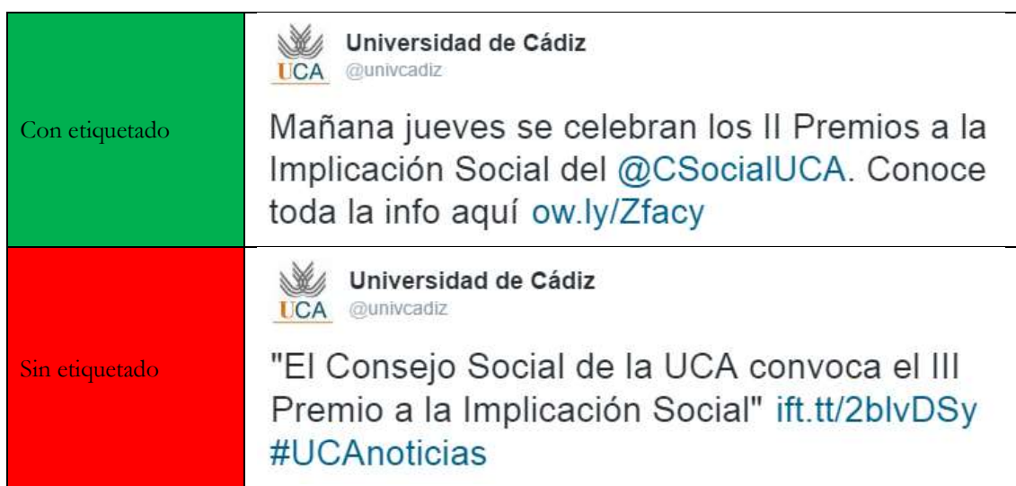
Ilustración 9. Etiquetado de stakeholders en Twitter.

Es importante que los perfiles vinculados a la UCA etiqueten a los stakeholders que puedan verse conectados con una determinada publicación. Habitualmente, esto sucederá porque dicho agente es protagonista en la publicación. Por ejemplo, si se difunde una noticia sobre el Consejo Social en Twitter, es conveniente usar el nombre de usuario @CSocialUCA en lugar del nombre de la institución. Esto permitirá que dicho perfil conozca nuestra publicación y pueda fomentar su difusión.