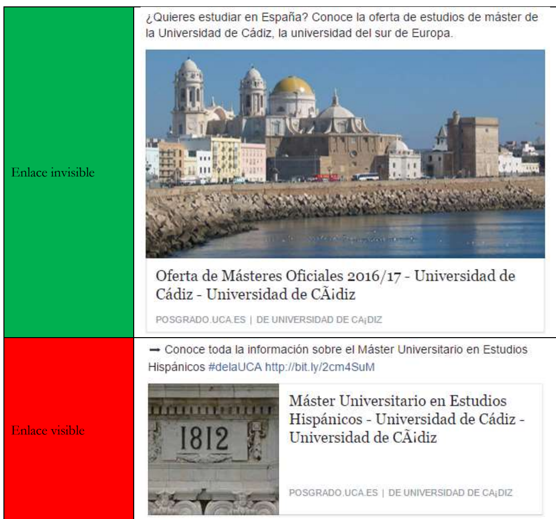
Ilustración 15. Enlaces en Facebook.