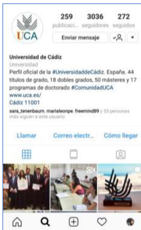
Ilustración 18. Captura móvil de la cuenta de Instagram de la Universidad de Cádiz.

Se trata de una de las redes sociales con un público de edad más baja, muy por debajo de Twitter, Google+ o Facebook, que cuentan con edades medias más elevadas. Esto convierte a Instagram en una red social especialmente importante para el público joven y, en nuestro caso, para los estudiantes de la Universidad de Cádiz.