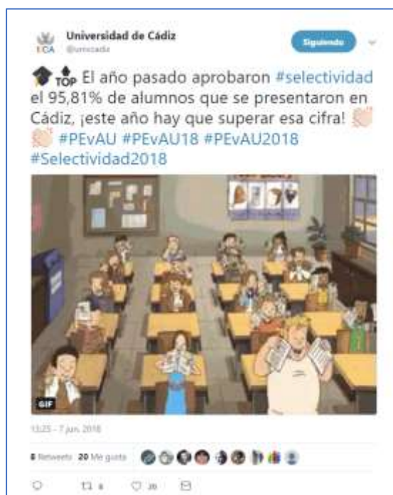
Ilustración 4. Ejemplo de publicación en Twitter.

retórica, etc. El objetivo debe ser captar la atención del usuario. Por ejemplo, la ilustración 4 muestra una publicación en la que básicamente se aporta un dato, pero se hace de un modo que pretende conectar con el público y acompañada de un gif animado.